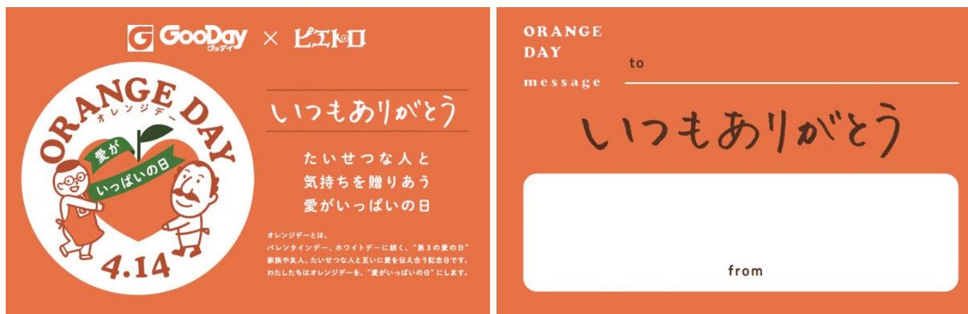
左：コラボロゴ入りのカード表面、右：メッセージが記入できるカード裏面

「オレンジ色」そして「福岡」にゆかりのある企業同士、オレンジデーを通して地元である福岡・九州の皆様へ感謝の気持ちを伝えたいという思いが合致。4月8日(土)～4月14日(金)の期間中、福岡を中心としたグッデイおよびピエトロの店舗へご来店のお客様へ、日頃の感謝の気持ちを込めて“グッデイ店長”と“ピエトロおじさん”がコラボしたオリジナルカードをプレゼントします。日頃、言葉にするのは照れてしまう感謝の気持ちを、カードに書いてたいせつな人へお渡しいただけます。(※なくなり次第終了)