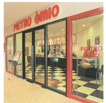
ミオミオの第1号店

“手軽で満足度が高い、カラダもココロも喜ぶ食事”をコンセプトに、サラダパスタ／ライスを中心として、ピエトロドレッシングで野菜や食材をお楽しみいただく『ミオミオ』が、これからもおいしさと健康をお届けしてまいります。