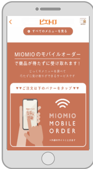
モバイルオーダー画面

ガラス張りの大きな窓が広がり、開放感のあるイートインスペースは、店外の緑豊かなガーデンを見ながら、ゆっくりとお過ごしいただける空間です。また、カウンター全席にコンセントを設置。お仕事中やお買い物の休憩に、お一人様でも気軽にお立ち寄りいただけます。