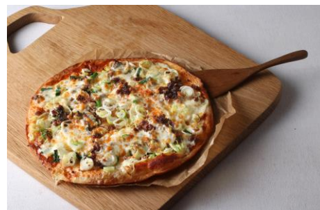
ねぎとひき肉/箱崎小町 （¥1,180+税）