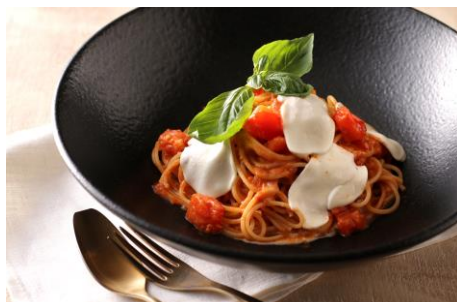
トマトとモッツアレラの 糸引きスパゲティ /元岡トマト （¥1,080+税）