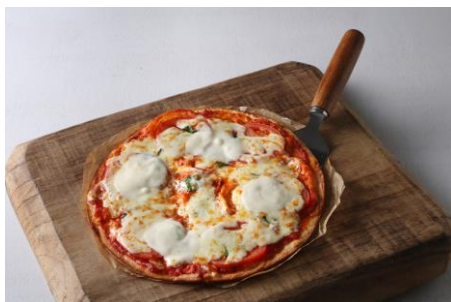
マルゲリータ/元岡トマト （¥1,280+税）

※期間中は、ピエトロの既存メニュー3品に「元岡トマト」・「箱崎小町」を使用しています。