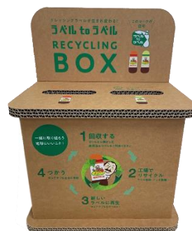
ラベル回収ボックス