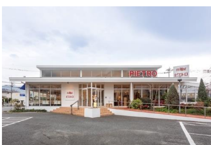
ピエトロ 次郎丸店 (福岡県福岡市早良区)