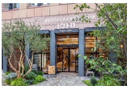
ピエトロ本店 セントラーレ (福岡県福岡市中央区)

2024年6月5日(水)から、ピエトロレストラン2店舗のレジ横に専用の回収ボックスを設置し、使用済みのラベルを回収いたします。