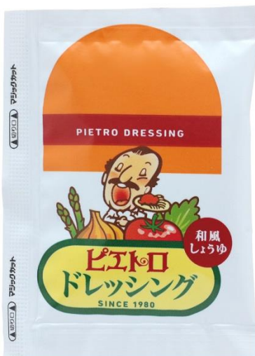
ピエトロドレッシング 和風しょうゆ(15ml)