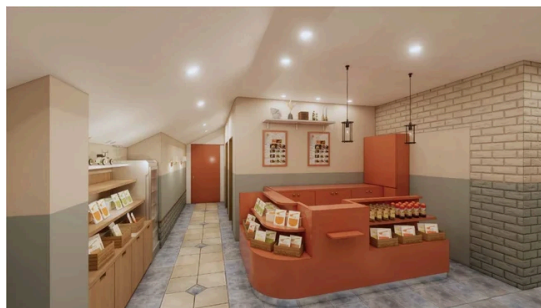
※エントランスイメージ