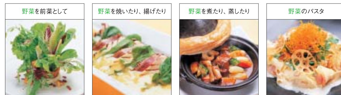
野菜を前菜として ベジエサラダ フレッシュリーフと カリカリベーコンのチーク仕立て