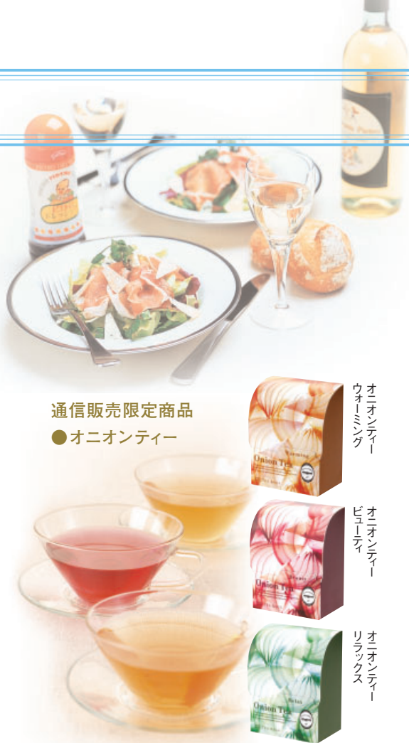
通信販売限定商品 ●オニオンティー

しかしながら、同業他社との競争激化はもとより量販店のPB(プライベートブランド)商品の強化等もあり、売上高は44億94百万円(前期比1.8%減)となり、さらに、原材料価格の高騰および販売促進費等の経費増も加わり、営業利益は13億29百万円(前期比11.8%減)となりました。