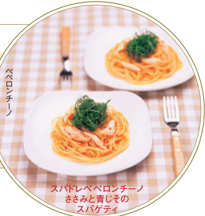
スパドレベロロンチーノ ささみと青じその スパゲティ