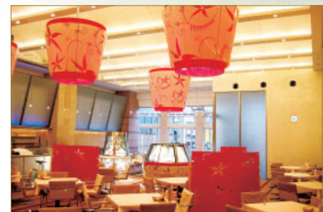
ピエトロセントラーレ

●所在地/福岡市中央区天神三丁目4番5号ピエトロビル1F ●電話/092-715-8281