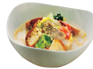
新感覚のスープたっぷりパスタ「イタリアー麵」2012年冬メニュー ローストチキンと冬野菜のクリームスープ